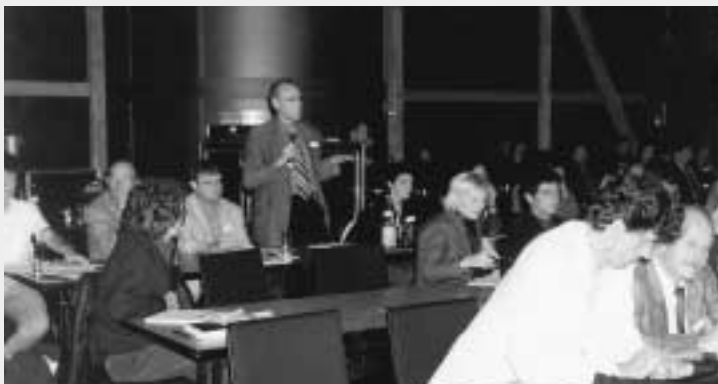
Rege Diskussion im Plenum: Naturwissenschaften und Sozialwissenschaften nicht über den gleichen Kamm scheren