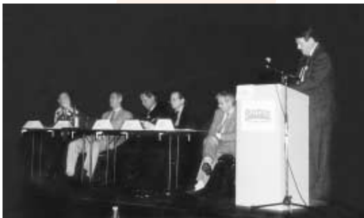
La qualité n'est pas une valeur absolue: participants au colloque.